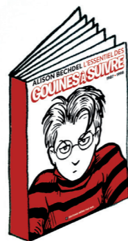
L'essentiel des gouines à suivre, d'Alison Bechdel

Avec Peau , paru initialement en 1994, Dorothy Allison signe une œuvre à la fois intime et politique. Cette Américaine se nourrit de son histoire familiale, de son expérience de militante lesbienne, mais aussi de ses lectures des penseuses féministes noires et chicanas. Elle multiplie les sujets (sexualité, littérature, inceste, misère sociale, ou encore « sex wars »), toujours avec un regard porteur d'une grande énergie. Cambourakis, 22 €