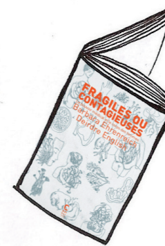
Fragiles ou contagieuses : le pouvoir médical et le corps des femmes, de Barbara Ehrenreich et Deirdre English