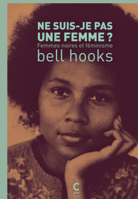
Ne suis-je pas une femme ? Femmes noires et féminisme, de bell hooks

C'est un aspect méconnu de l'histoire du féminisme, pourtant passionnant : au milieu des années 1970, des femmes qui en avaient assez de subir le patriarcat ont décidé de tout lâcher et de partir fonder des communautés de lesbiennes féministes, dans l'ouest des États-Unis. Avec cet ouvrage des excellentes éditions féministes iXe, Françoise Flamant nous plonge au cœur de ces initiatives qui ont tenté de construire la vie autrement. Éditions iXe, 19 €