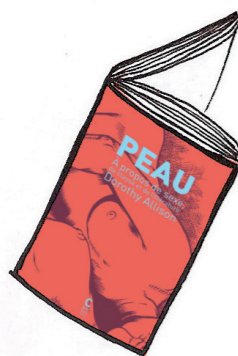
Peau, à propos de sexe, de classe et de littérature, de Dorothy Allison