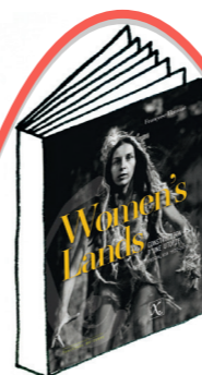
Women's Lands, de Françoise Flamant

Les dessins de Muriel Douru, illustratrice à qui l'on doit notamment plusieurs livres pour enfants traitant d'homosexualité, sont toujours bigarrés et joyeux. Son trait, telle une petite douceur, aide à faire passer des messages piquants. Dans cet album autobiographique, la blogueuse tacle les homophobes de la Manif pour tous ou les harceleurs du métro et livre avec franchise son parcours de femme « qui n'a pas envie de passer sa vie dans un placard ». Marabout, 14,90 €